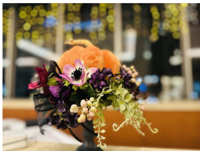
フロントカウンター 装飾