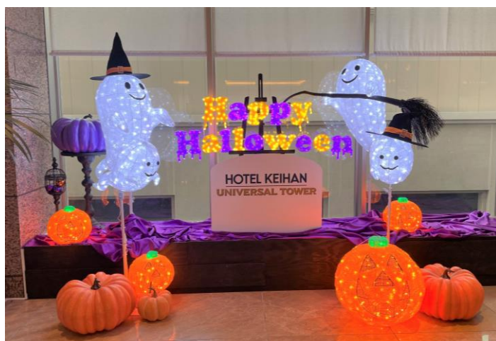
4階フォトスポット