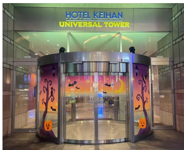
ユニバーサルシティ駅側エントランス

ユニバーサルシティ駅側のエントランスから、フロントまで続くハロウィーン装飾をお楽しみいただけます。お客さまの撮影スポットとして人気の大階段は、昼・夜で雰囲気が変わるので、ご宿泊の際にはぜひどちらも記念撮影を。