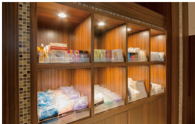
アメニティバー Amenity bar (※アメニティの内容は、時期によって異なります。 The lineup may be changed.)