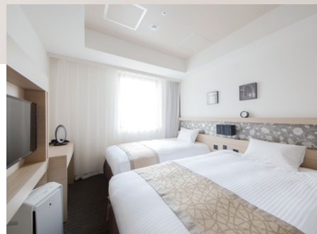
スタジオツインルーム Studio twin room