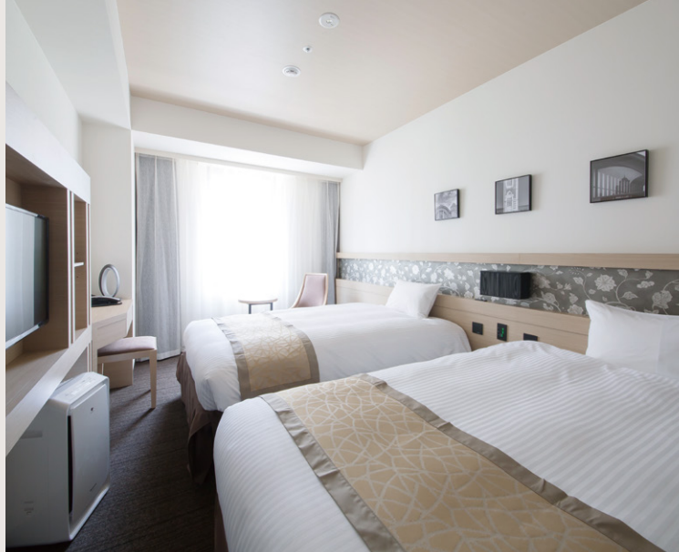
ツインルーム Twin room

We promise you a relaxing stay with comfortable beds and complete array of amenities.