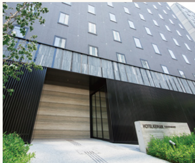
ホテル京阪 淀屋橋 エントランス Hotel Keihan Yodoyabashi appearance