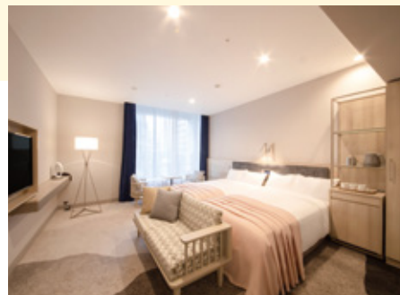
ユニバーサルルーム Universal room