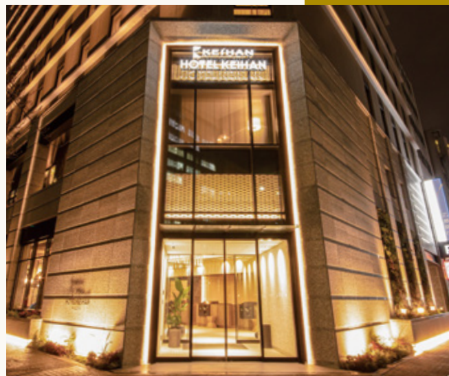
ホテル京阪 名古屋 外観 Hotel Keihan Nagoya Appearance