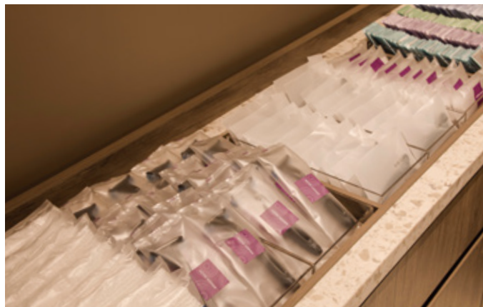
アメニティバー Amenity bar (※アメニティの内容は、時期によって異なります。 The lineup may be changed.)