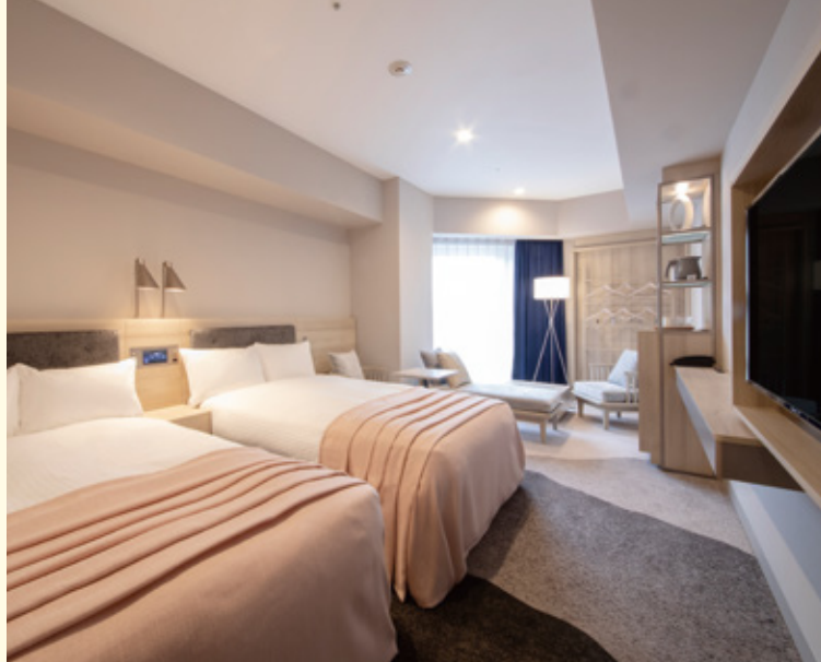
スーベリアツインルーム Superior twin room

We promise you a relaxing stay with comfortable beds and complete array of amenities.