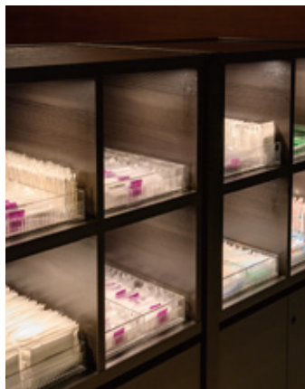
アメニティバー Amenity bar