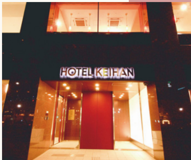
ホテル京阪 浅草 外観 Hotel Keihan Asakusa appearance