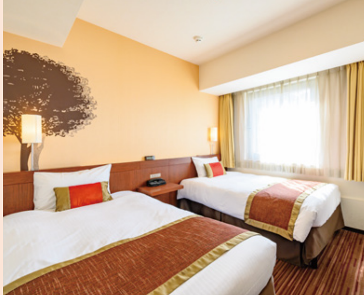
カジュアルツインルーム Casual Twin room

We promise you a relaxing stay with comfortable beds and complete array of amenities.