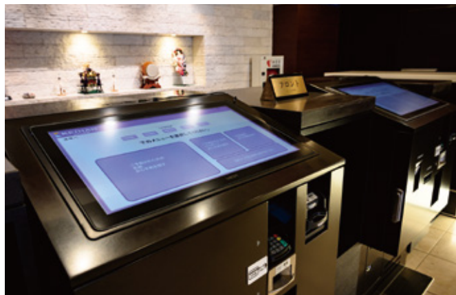
自動チェックイン機 Front desk