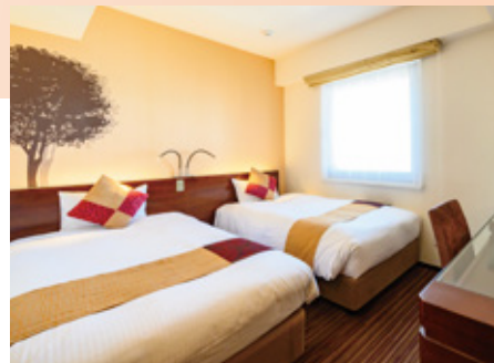
ツインルーム Twin room