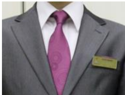
「京むらさき」に砂紋柄のネクタイ