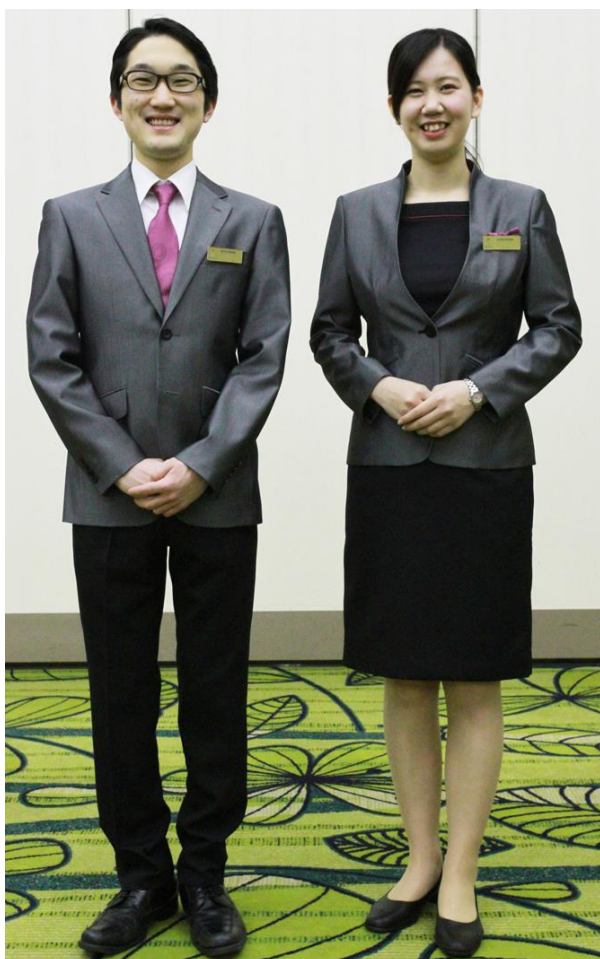
グレーと黒のブレザータイプ