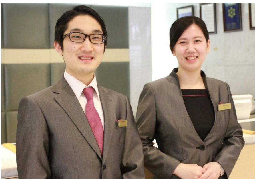
ホテル京阪 グランデの新制服